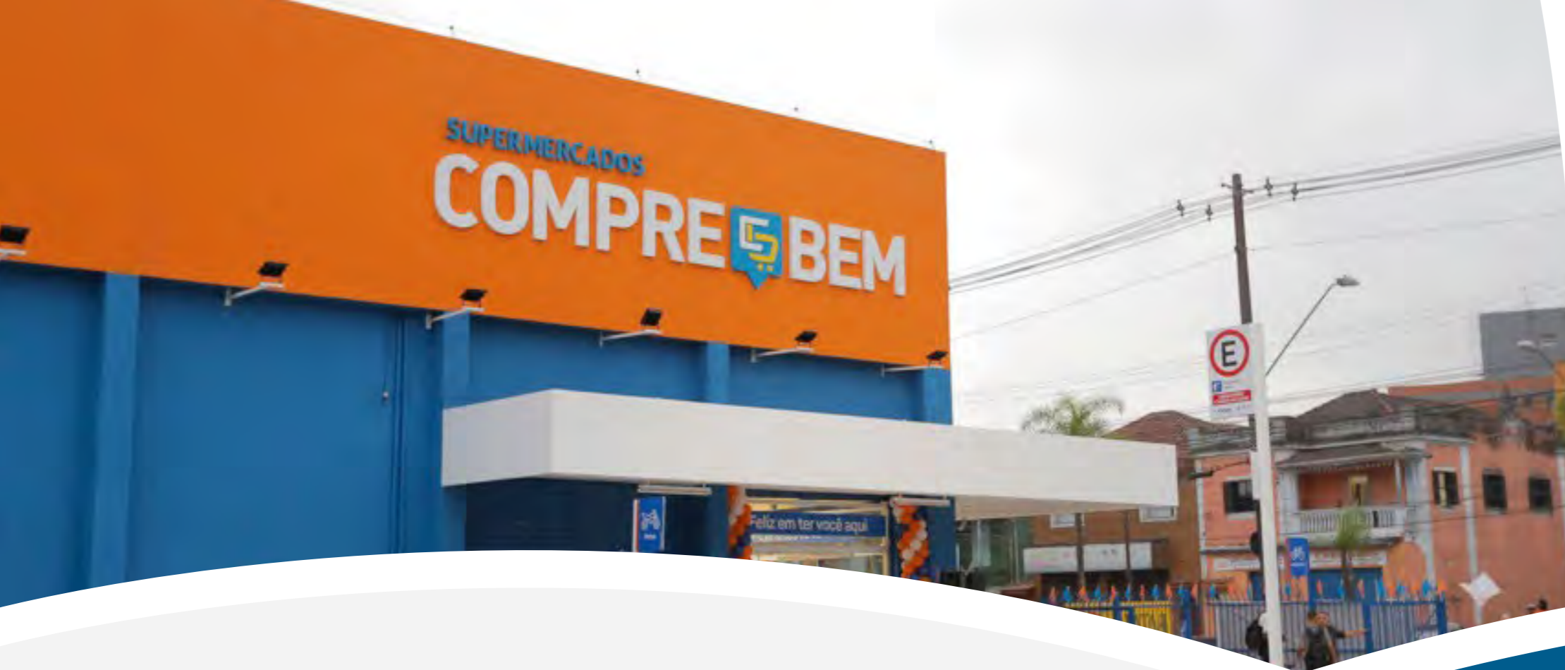
Imagem e reputação

A imagem e a reputação do GPA são importantes atributos perante nossos(as) clientes e a sociedade. Devemos zelar pelo respeito ao nome e pelo bom uso de nossas marcas. Protegemos nossa propriedade intelectual e cuidamos para que nossas marcas, domínios e desenhos industriais sejam devidamente registrados para impedir o uso indevido por terceiros(as). Não admitimos que colaboradores(as) e parceiros(as) comerciais façam uso ou publicidade dos nomes empresariais, marcas depositadas ou registradas, logotipos ou quaisquer outros sinais distintivos do Grupo, sem autorização expressa de nossas áreas responsáveis.